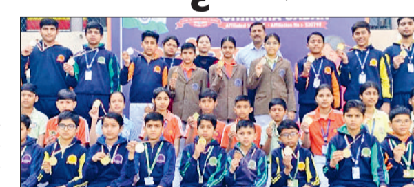
राई। शानदार प्रदर्शन के बाद छात्र प्रधानाचार्य के साथ।

ओम शांति शिक्षा सदन विद्यालय के विद्यार्थियों ने सीपीएस जनरल नॉलेज ओलंपियाड में शानदार प्रदर्शन करते हुए विद्यालय का नाम रोशन किया है। प्रतियोगिता के परिणाम विद्यालय के लिए अत्यंत गौरवपूर्ण रहे। विद्यार्थियों ने कुल 37 पदक अर्जित किए, जिनमें 26 स्वर्ण, 7 रजत तथा 4 कांस्य पदक शामिल हैं। सभी विजेता विद्यार्थियों को मेडल के साथ प्रमाणपत्र प्रदान किए गए। विद्यालय परिसर में