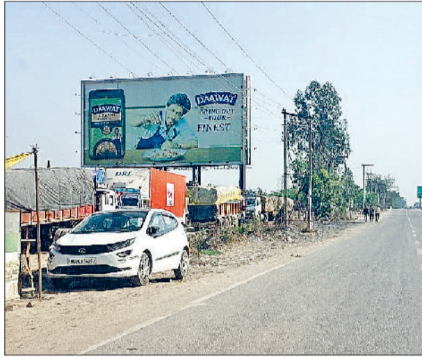
सोनीपत। जीटी रोड पर बिना अनुमति के लगा कंपनी का होर्डिंग्स।

शहर में कई जगहों पर बिना अनुमति के बड़े-बड़े होर्डिंग्स, फ्लैक्स व पोस्टर लगाकर शहर की सुंदरता को ग्रहण लगाया जा रहा है। विभिन्न व्यवसायिक कंपनियों व शैक्षणिक संस्थान बिना अनुमति लिए अपने फायदे के लिए जगह-जगह बड़े-बड़े होर्डिंग्स लगा रहे हैं। ऐसे में नगर निगम ने अतिक्रमण हटाओ अभियान के बाद व्यवसायिक लाभ के लिए बिना अनुमति पोस्टर व होर्डिंग्स लगाकर शहर की सुंदरता बिगाड़ने वालों के खिलाफ सख्त रवैया अपनाना शुरू कर दिया है। नगर निगम ने बिना अनुमति इन व्यवसायिक होर्डिंग्स लगाने वाले 3 व्यवसायिक कंपनियों के खिलाफ दो पुलिस थानों में शिकायत देकर मुकदमा दर्ज करने की मांग की है, ताकि अवैध रूप से होर्डिंग्स लगाने वालों के खिलाफ कार्रवाई की जा सके। नगर निगम अधिकारियों की मांनें तो कुछ व्यवसायिक लोग अपनी प्रचार सामग्री को धड़ल्ले से शहर में कहीं भी लगा रहे हैं। यह लोग प्रतिबंधित क्षेत्रों सहित शहर में विभिन्न जगहों पर प्रचार सामग्री लगाने से भी पीछे नहीं हट रहे हैं, जबकि शहर में पोस्टर, बैनर, होर्डिंग्स, फ्लैक्स बोर्ड सहित किसी भी प्रकार की प्रचार सामग्री को लगाने के लिए नगर निगम से अनुमति लेना अनिवार्य है। जिन क्षेत्रों में चार्ज लागते हैं, वहां के लिए निर्धारित दरों से चार्ज जमा करवाना होता है, लेकिन शहर में व्यवसायिक लाभ हासिल करने के लिए लोग प्रचार सामग्री को बिना अनुमति मनमर्जी से शहर में खंभों, चौक-चौराहों या भवनों की इमारतों पर