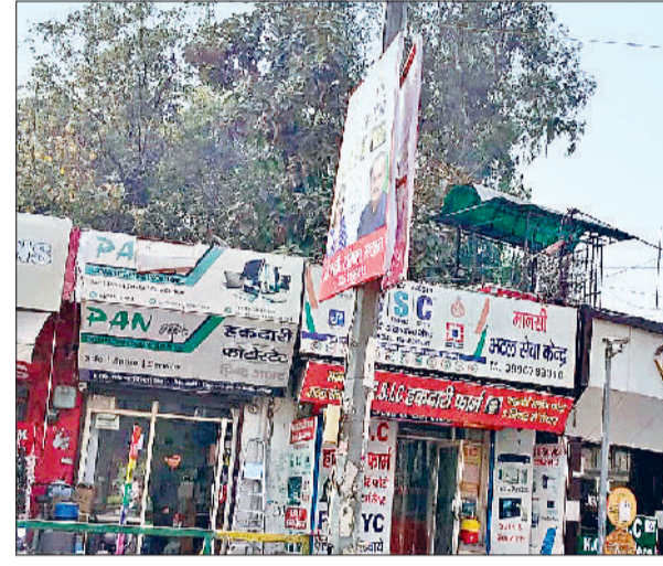
सोनीपत। कच्चे क्वार्टर मार्केट रोड पर खंभे पर बिना अनुमति के लगा फ्लैक्स बोर्ड।