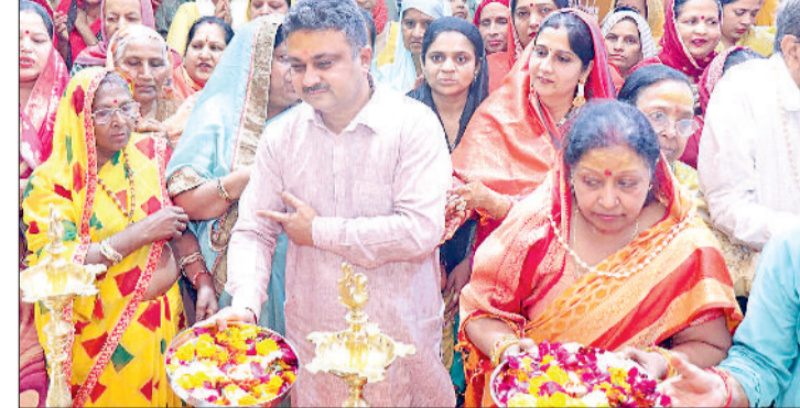
सोनीपत। श्रीदेवी चिट्ठाने वाली माता मंदिर सिद्धपीठ में श्री रामकथा के बाद आरती करते श्रद्धालु।